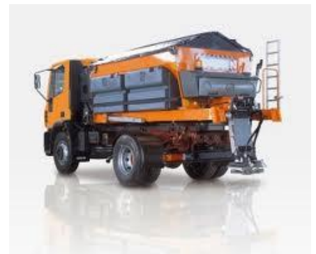
Protection de matériel en période de non utilisation