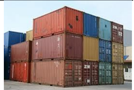
Protection de matériel en transit maritime